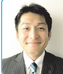
埼玉県立熊谷高等技術専門学校 元講師

1980年埼玉県行田市に生まれる。埼玉県立進修館高校を卒業後、埼玉県立熊谷高等技術専門学校に再入学し、IT分野全般を修学する。平成11年に卒業するが、特にコンピューター技術に精通し極めて高い能力を取得したため、卒業と同時に同校の専任講師となる。なお、「第37回技能オリンピック機械製図部門」において優秀な成績を収めている。