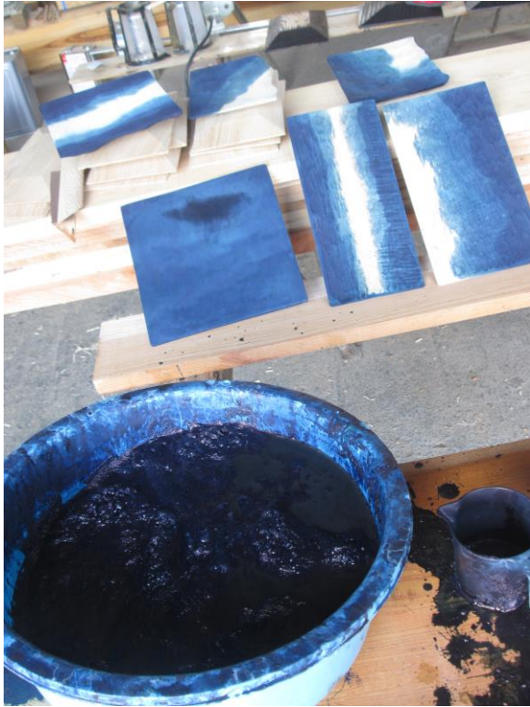
【藍染め作業の様子】

30年ほど前には、20軒余りあった銘木業の人たちも今では数名になり、目利きの出来る者が減少している状況です。